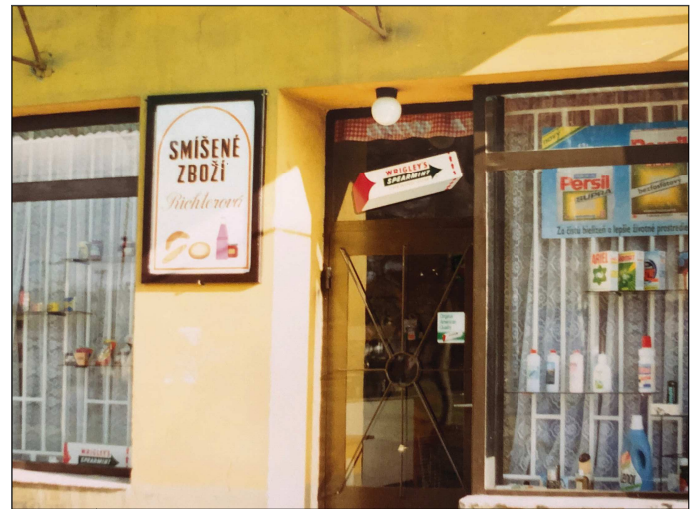
Pohled na samoobsluhu v roce 1991, kdy byla provozována Květou Richterovou a nyní.