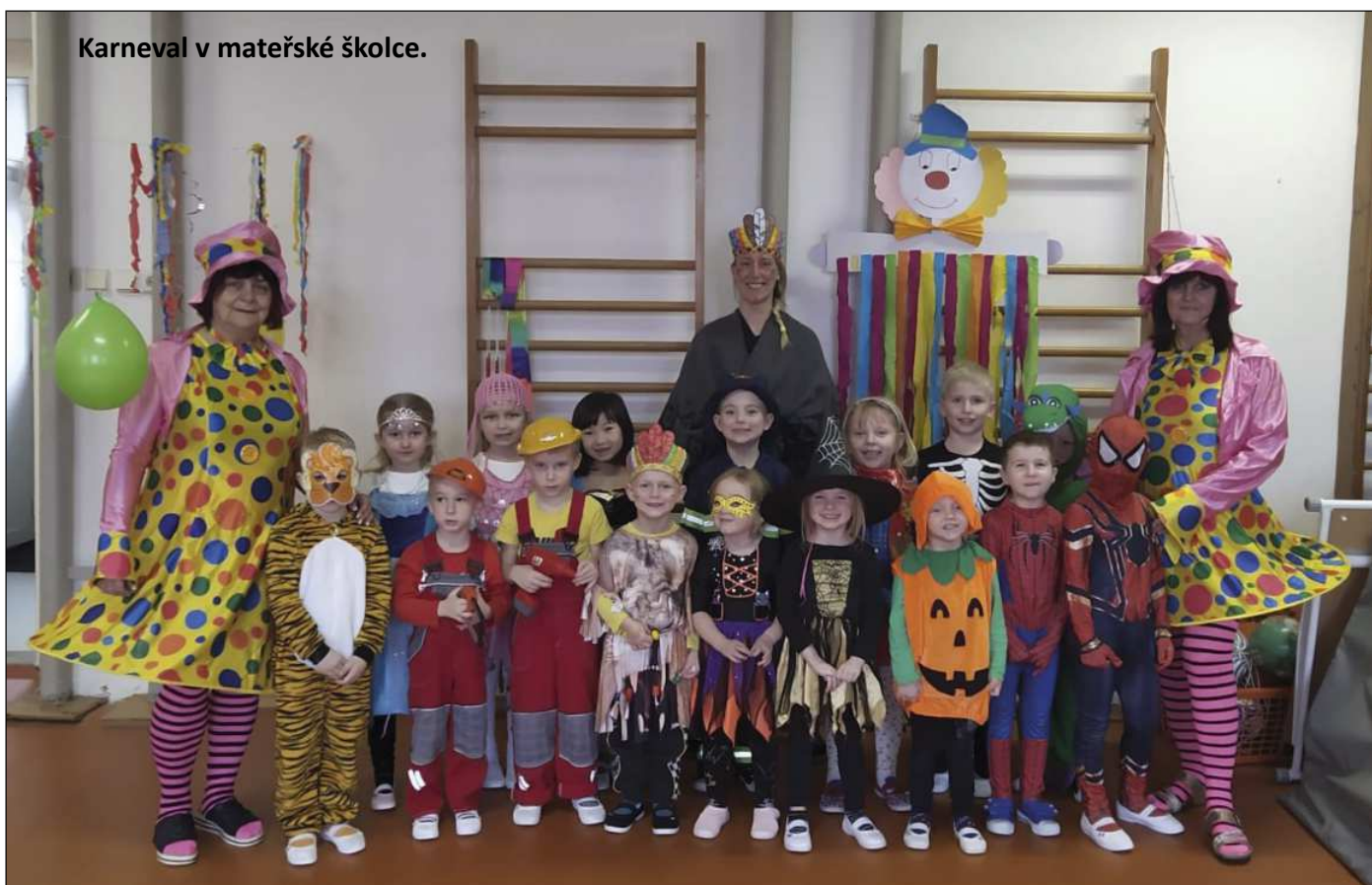
Karneval v mateřské školce.

nách uskutečnil Masopust. Rok se s rokem sešel a opět nastalo veselé období masopustu. A tak i my, ve školní družině, jsme se poslední únorový týden začali připravovat na masopustní průvod. Družinu i školu jsme vyzdobili barevnými dekoracemi a škraboškami. V úterý 27. února se ve škole sešly různé maškary,