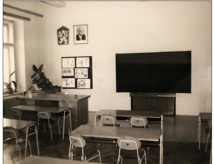
Jedna ze tříd základní školy ve Dvorch v roce 1985 a nyní.