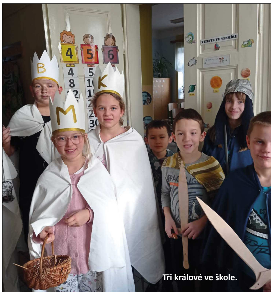
Tří králové ve škole.

Na konci ledna 2024 nás čekalo pololetní Vysvědčení, a tak jsme přemýšleli, jak děti odměnit za jejich půlroční snahu ve škole. Rozhodli jsme se tedy dětem darovat zážitek a proto jsme navštívili