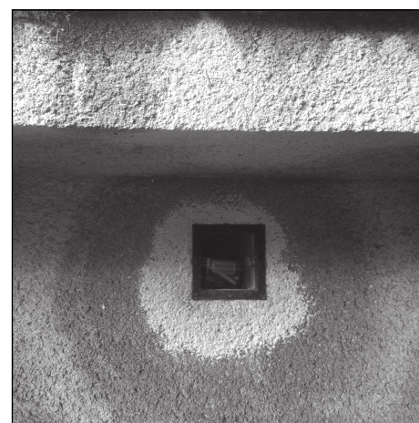
Vzhled a umístění tradiční keše.

Pohyb – pro zakládání kešek platí určitá pravidla. Například není možné, aby se na jednom místě nacházelo více keší. K přemísťování mezi kešemi můžeme využít řadu dopravních prostředků, ať už se