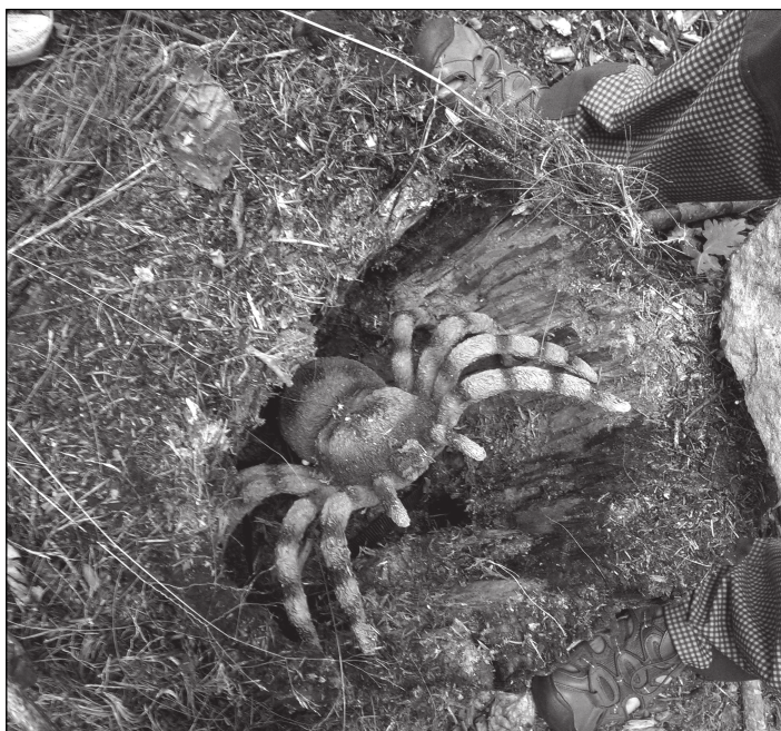
Nález děsivý, ale útroby pavouka ukrývají poklad.

4. Zamaskuješ - Při vracení kešky zpět do jejího úkrytu nezapomeň maskování - minimálně tak, jak byla zamaskovaná při tvém příchodu.